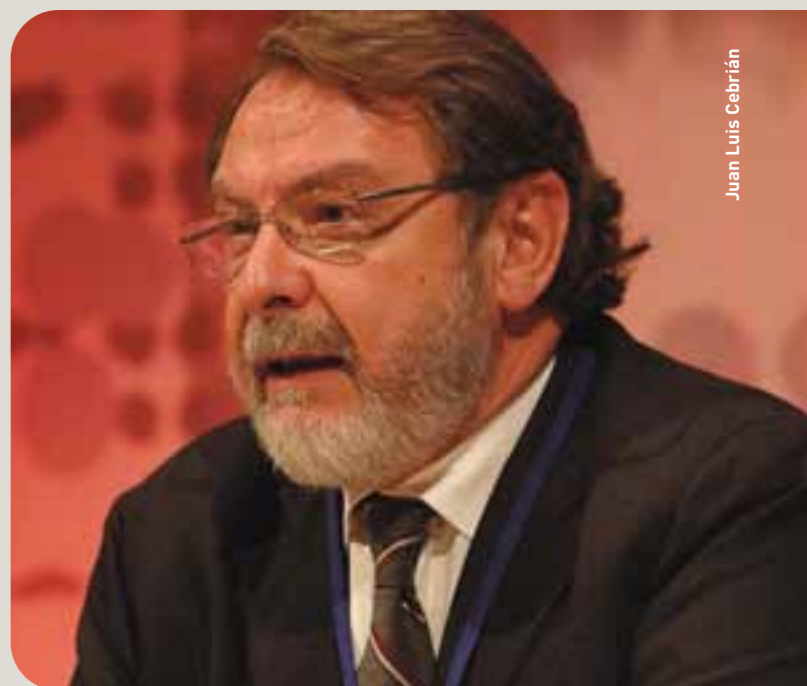
Juan Luis Cebrián